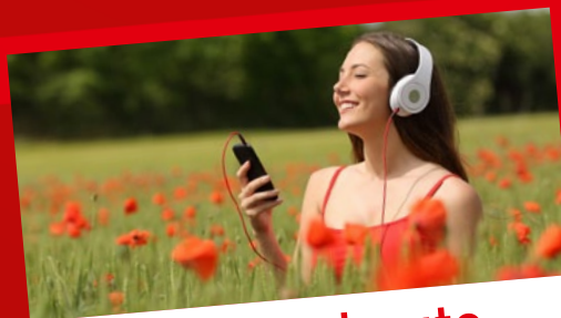
Hits von heute